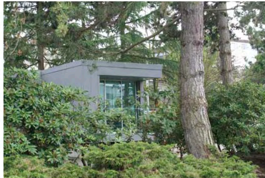
ליבו הפועם של הבית ירדוטי לטביבה כולו: חימום וקירור סולריים, טכניקות בנייה ברות-קיימא, הכוללות חומרים לא רעילים, תאורת LED, חיפוי אבץ, נג ירוק ופתחים לאיוורור טבעי