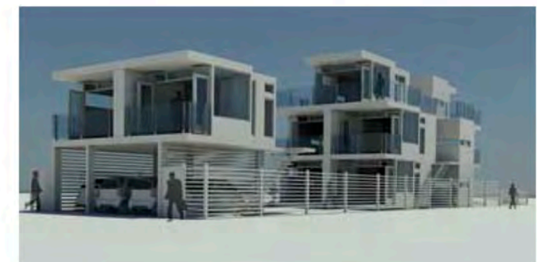
ניתן לצרף את קוביות הבתים למתחם המזכיר את המבנן של אדריכל טפדיה בתערוכת "הביטאט 67"