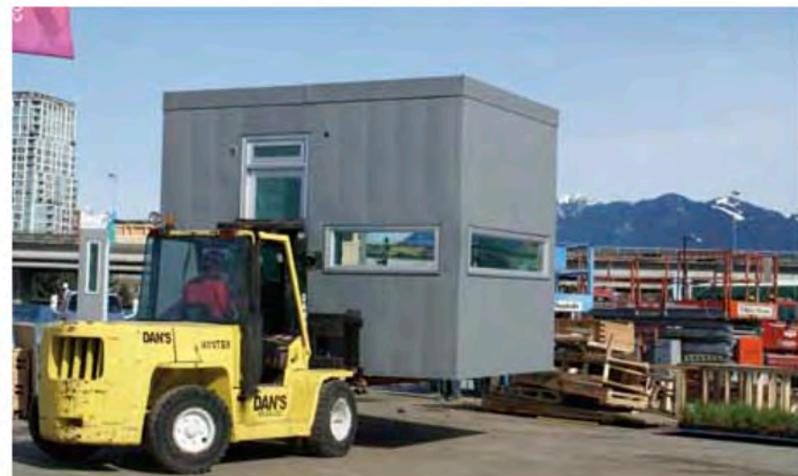
הבית קל במשקל בצורה מפתיעה, רובו בנוי יחידות עץ מודוליות זו לזו ליצירת חוזק